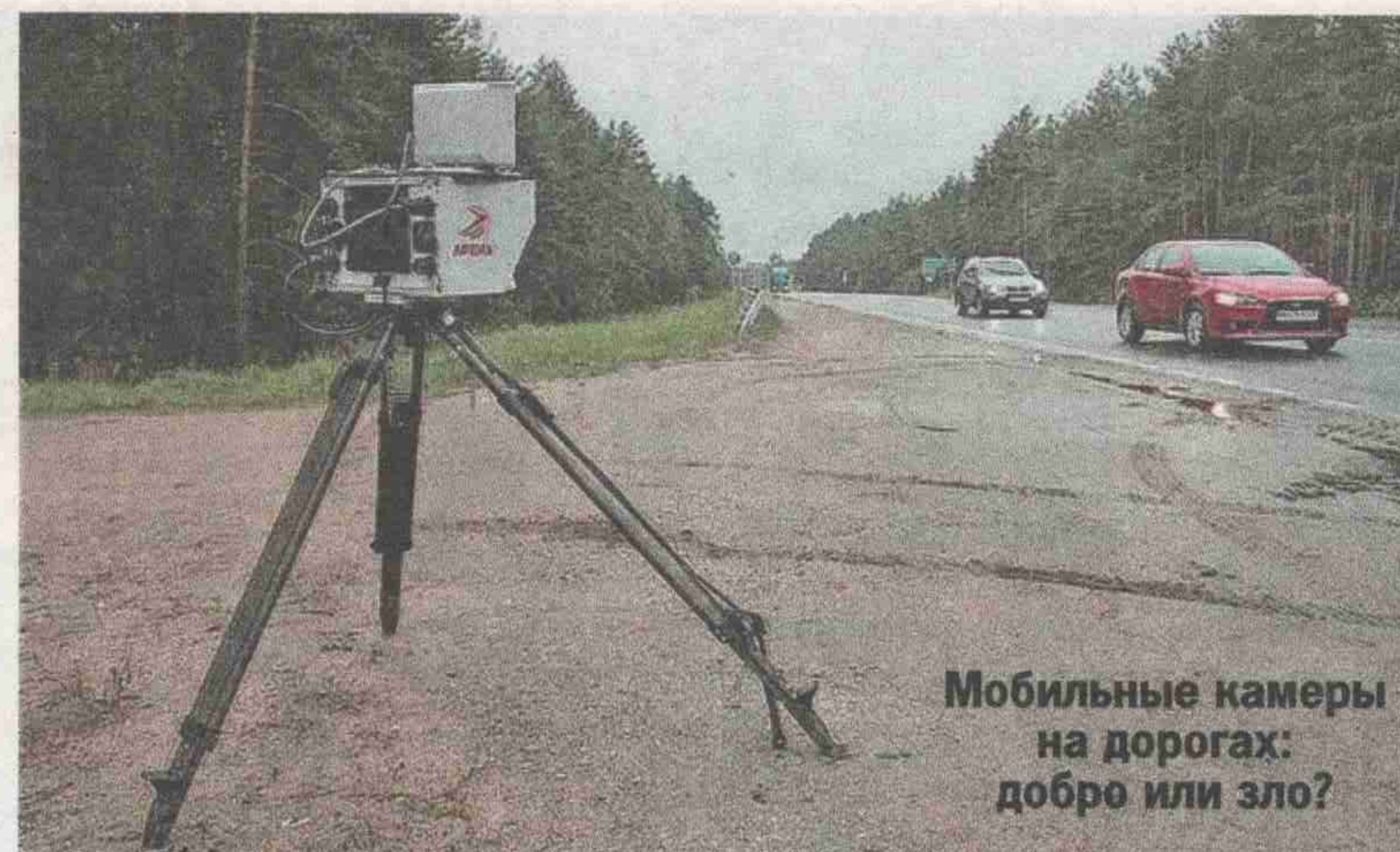
Мобильные камеры на дорогах: добро или зло?

На меня не раз нападали. Были случаи: пытались па-